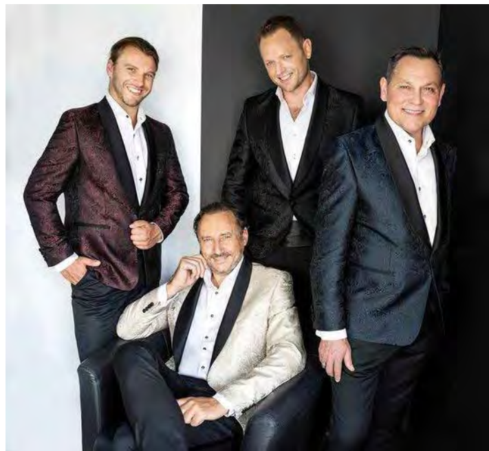
4 Tenoři