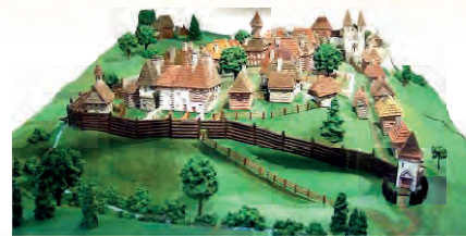
Model středověkého osídlení města – hradebního kostela. Největší a nejodolnější exponát stálé muzejní expozice města v Nočním zámku Kostelec nad Orlicí.

Pojďme se tedy společně projít naším městem a uvidíme, co objevíme.