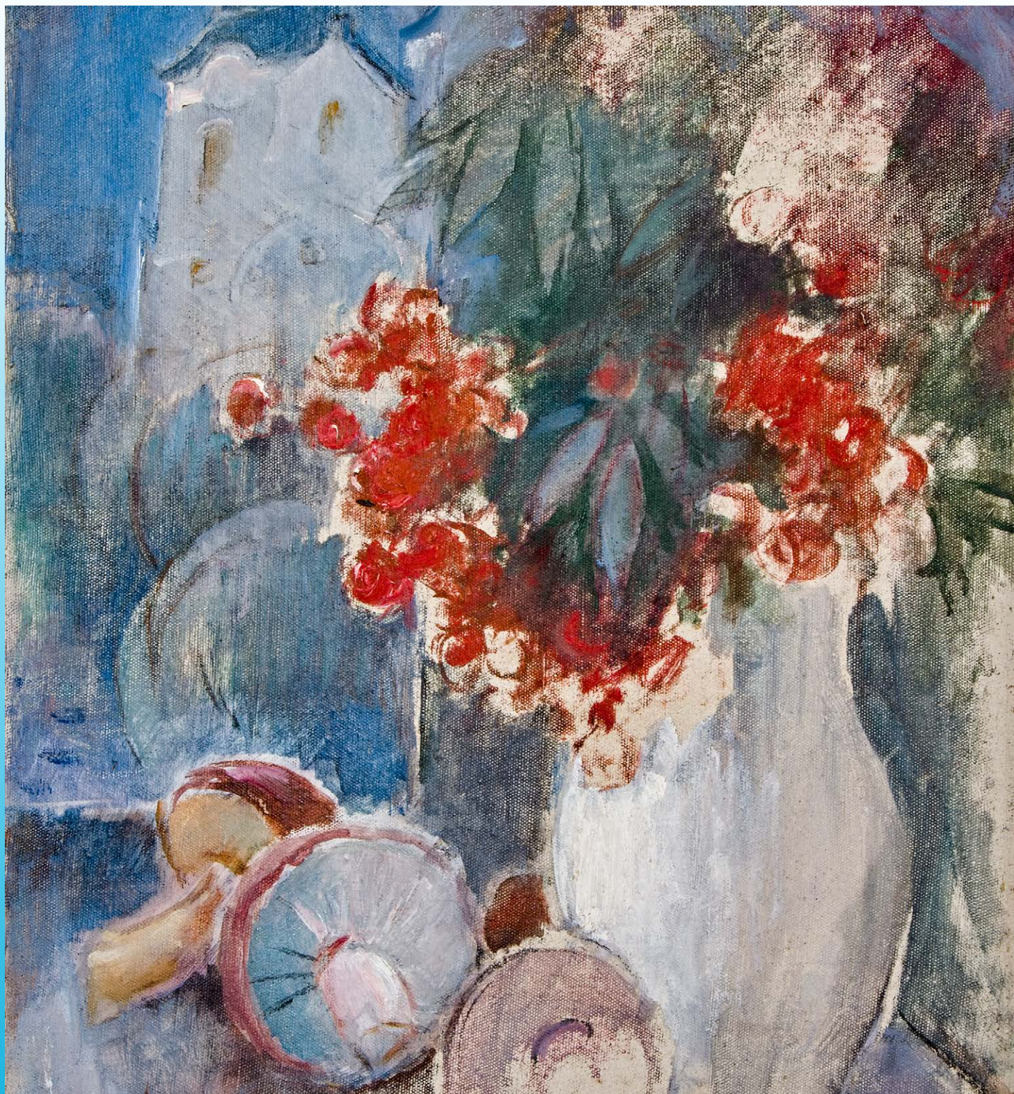
Obraz Rudolfa Černého