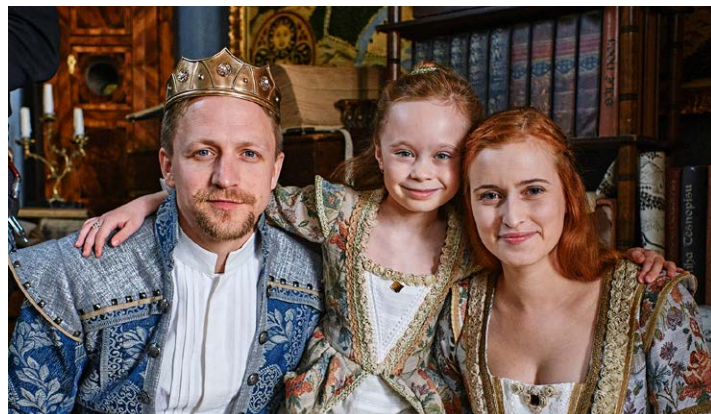
Tajemství staré bambitky 2

Jak byste se chovali, kdybyste jeli ve vlaku, který nikdo neřídí? Odpověď na tuto otázku hledá Jiří Havelka, režisér a scenárista diváckého hitu Vlastníci ,