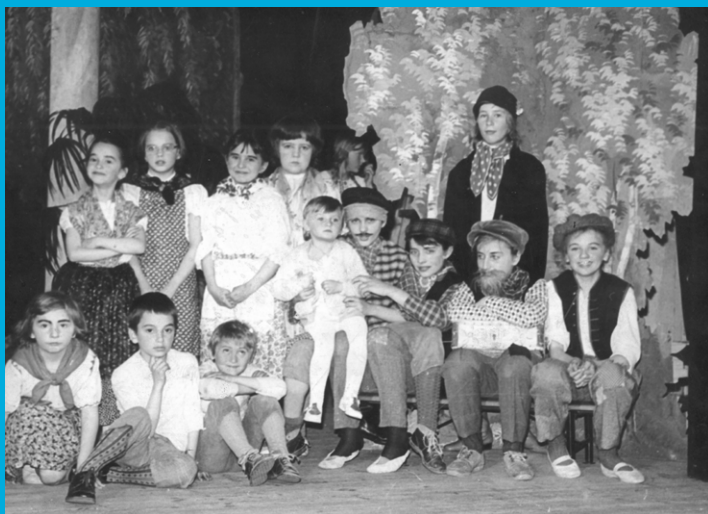
Fotografie z divadelního představení Zahrada víl (27. února 1978)