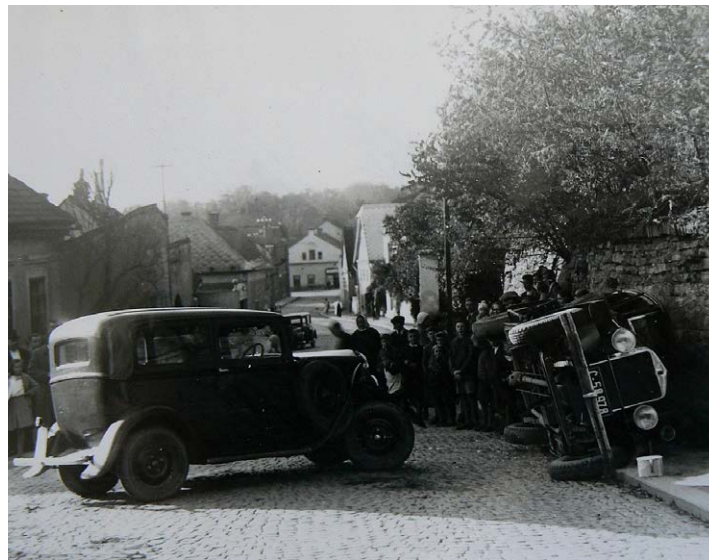
Dopravní nehoda v Zoubkově ulici u Žofínské ul.