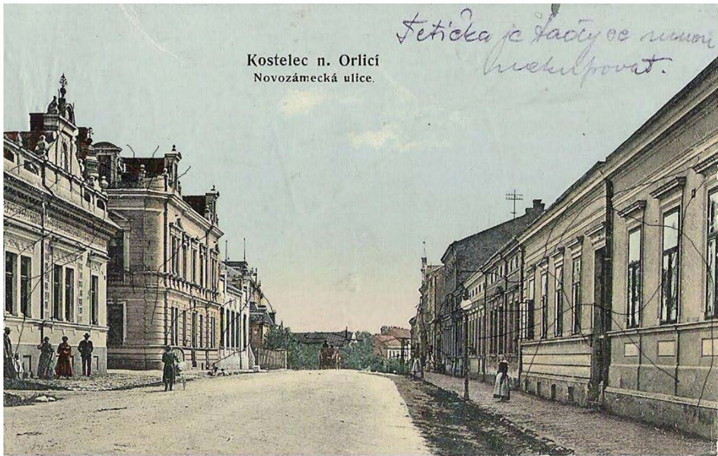
Novozámecká ulice, později Komenského ul.