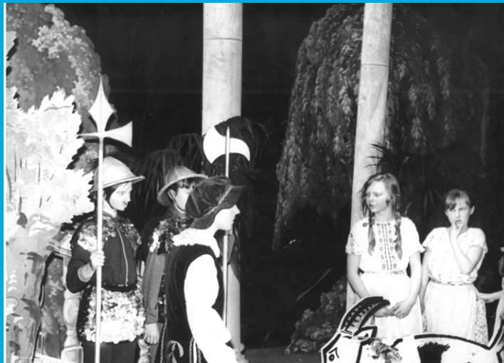
Fotografie z divadelního představení Zahrada víl (27. února 1978)