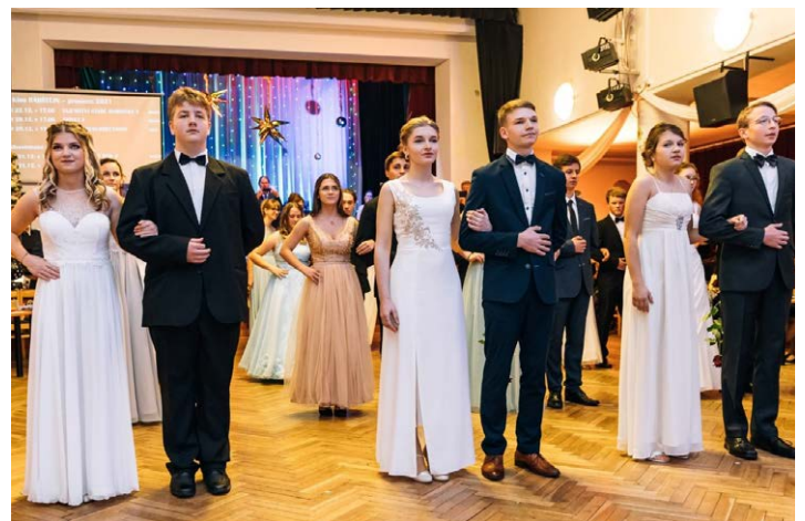
Frekventanti kurzu Tanečních na Rabštejně – Slavnostní Věneček.

DĚKUJEME všem zúčastněným za vstřícnost a vytvoření krásné atmosféry!