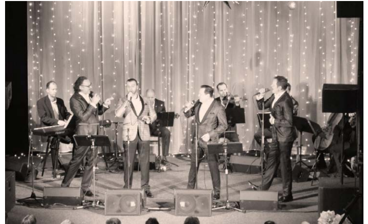
Vánoční galakonzert Rabštejn 2021 - 4 Tenoři

Nyní Vám přinášíme dvě fotografie z tohoto Galakonzertu na Rabštejně. Další fotografie z koncertu si můžete prohlédnout na www.skrabstejn.cz