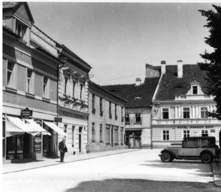
K ulici Nádražní později Tyršově

Nádražní ulice (dnes Tyršova ul.). Označení této ulice bylo umístěno na budově č. p. 17 a 18, tedy na staré radnici, od níž vedla tato komunikace směrem ke starému zámku a před ním se uhýbala vpravo dolů k vlakovému nádraží.