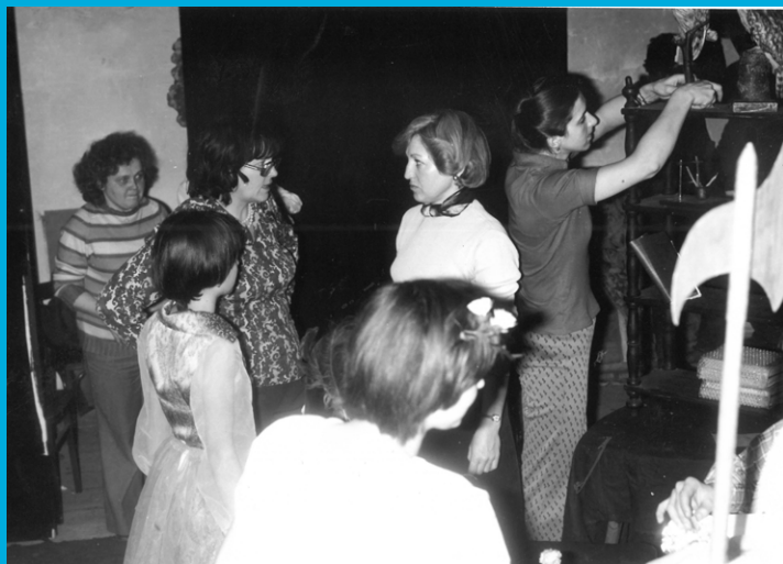
Fotografie z divadelního představení Zahrada víl (27. února 1978)