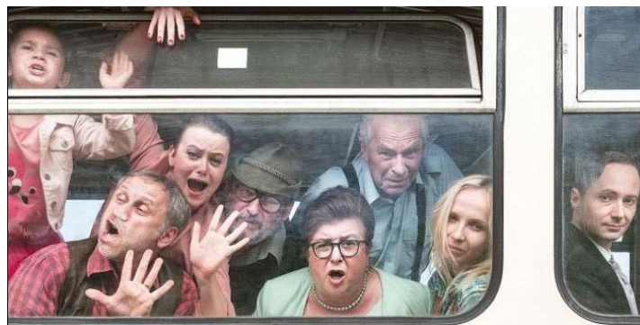
Film Mimořádná událost

Komedie Mimořádná událost se volně inspirovala skutečným příběhem „splášeného vlaku“ , který ujel svému strojvůdci i s cestujícími před pár lety na Českomoravské vrchovině. Jiřímu Havelkovi nešlo o věrnou rekonstrukci případu, ale o další zábavný ponor do světa úplně normálních lidí, kteří se ocitnou v extrémní situaci. Možná byste se divili, kolik toho můžou mít společného vypjatá domovní schůze a vlak, který nikdo neřídí.