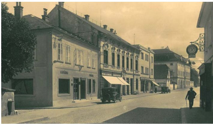
Nádražní ulice ke Starému zámku