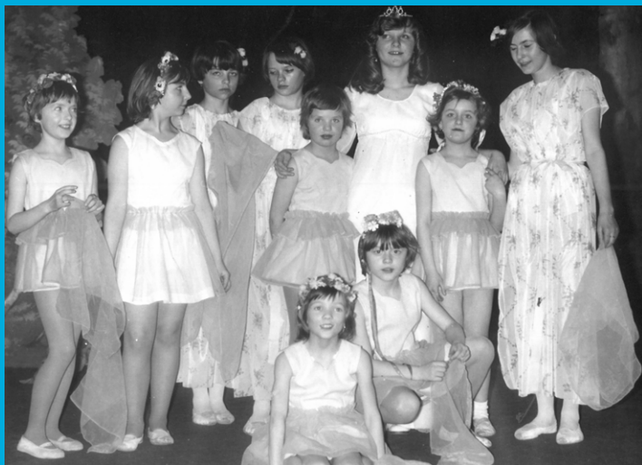
Fotografie z divadelního představení Zahrada víl (27. února 1978)