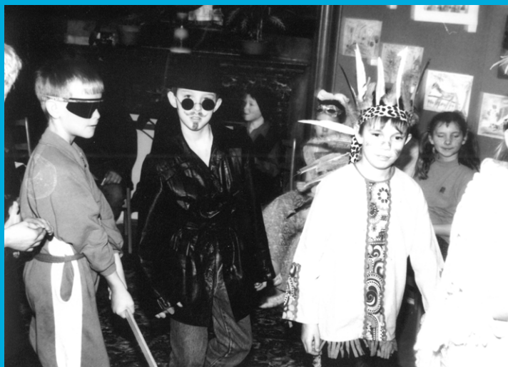
Fotografie z divadelního představení Zahrada víl (27. února 1978)