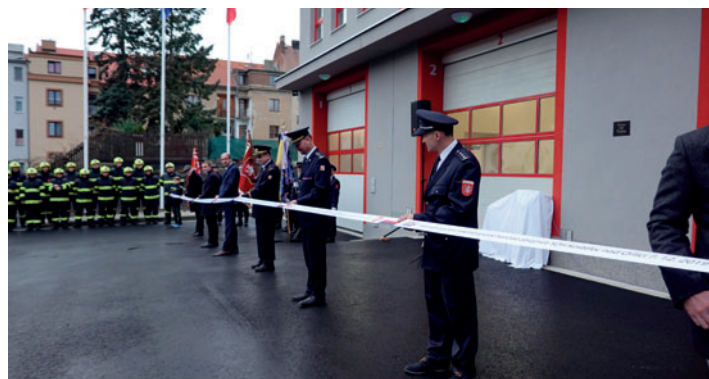
Slavnostním otevření 7. 12. 2019