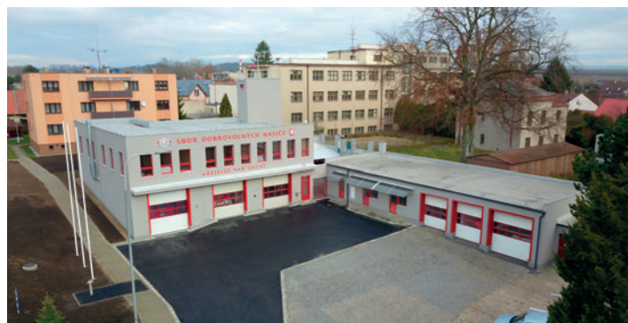
Nově zrekonstruovaná a přístavěná zbrojnice