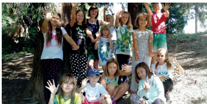
Tábor s angličtinou I