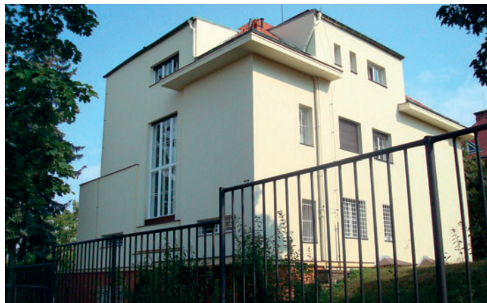
boční a zadní trakt