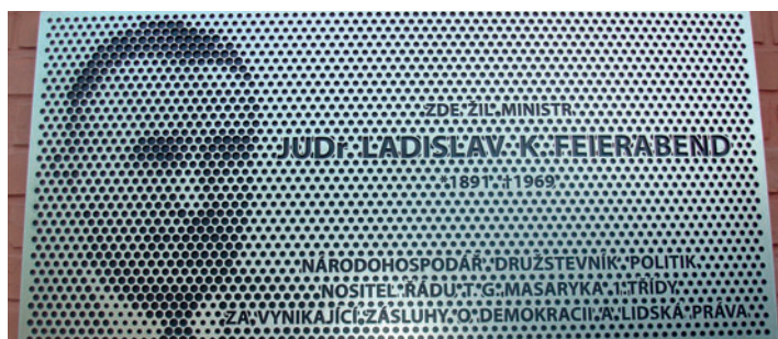
pamětní deska na vile