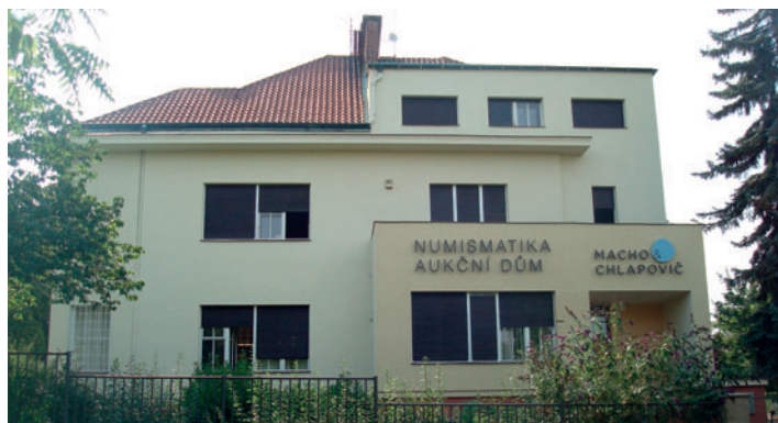
Vila rodiny Feierabendovy v Praze na Ořechovce