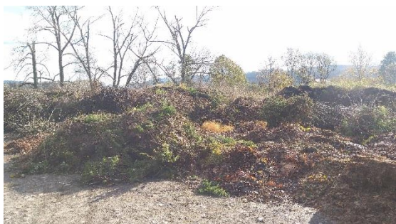
1) Nezpracovaný bio odpad: