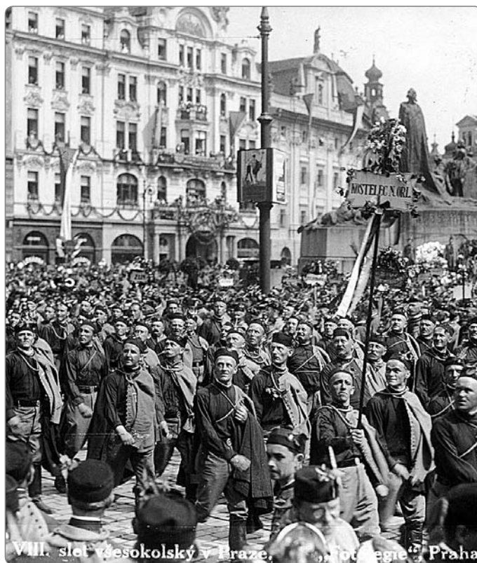
Všesokolský slet Praha