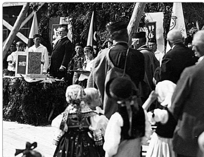
Kladení základního kamene sokolovny