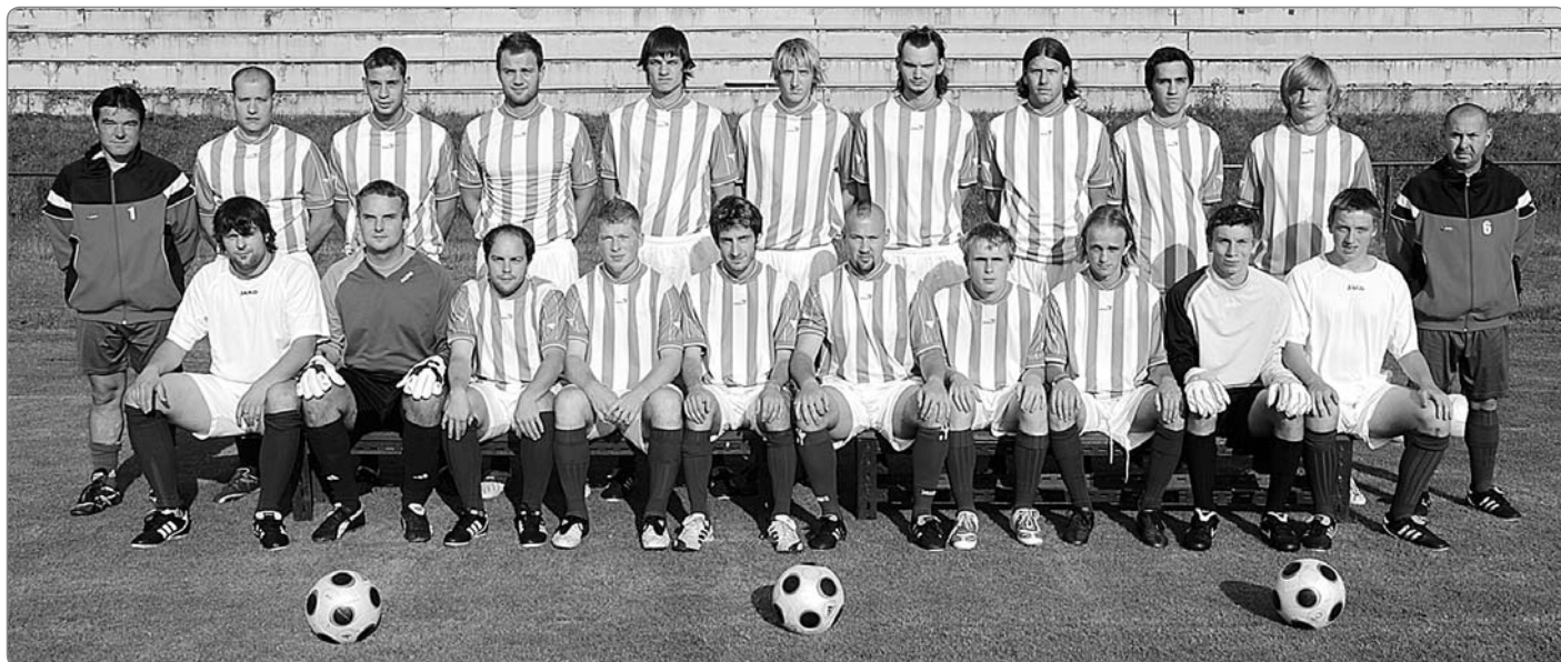
Foto: A mužstvo FC Kostelec nad Orlicí