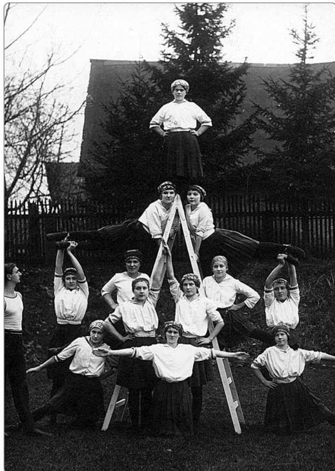
Polovina 30 let