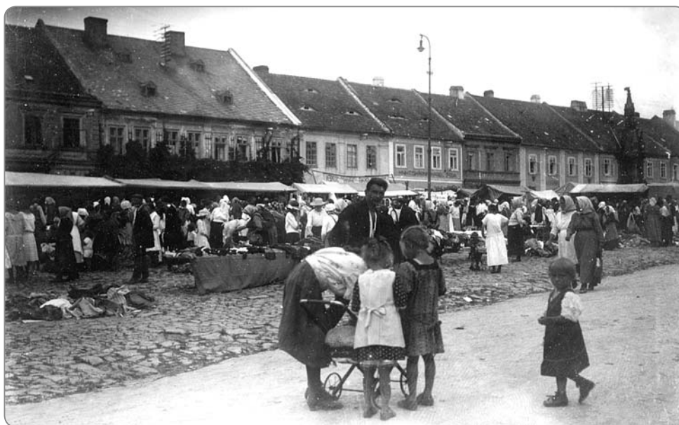
Jarmark a výroční trhy se odbyvaly na náměstí.

tendence ke třídnímu a stavovskému vyhranění společnosti od 13. století na vyšší a nižší šlechtu. Tu následovalo i duchovenstvo v sociálním a právním ohledu. V průběhu 14. století nastává i diferenciaci venkovského obyvatelstva. Ve městech dochází k ostrým protikladům mezi bohatými měšťany, ře-