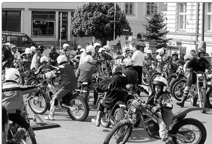
Nedělní ráno... předstartovní trialová atmosféra.. (Kostelec nad Orlicí, 7. 5. 2000,).

V pátek 1. 8. 2008 proběhne administrativní a technická přejímka soutěžících, servis, tedy místo, kde budou posádky parkovat vozidla, umístíme v areálu kasáren. Odpoledne, v 15. hodin, rallye slavnostně zahájíme na náměstí a v 18. hodin posádky odstartují do prvního měřeného úseku na území města, průjezd všech cca 80-90 vozů bude trvat necelé dvě hodiny.