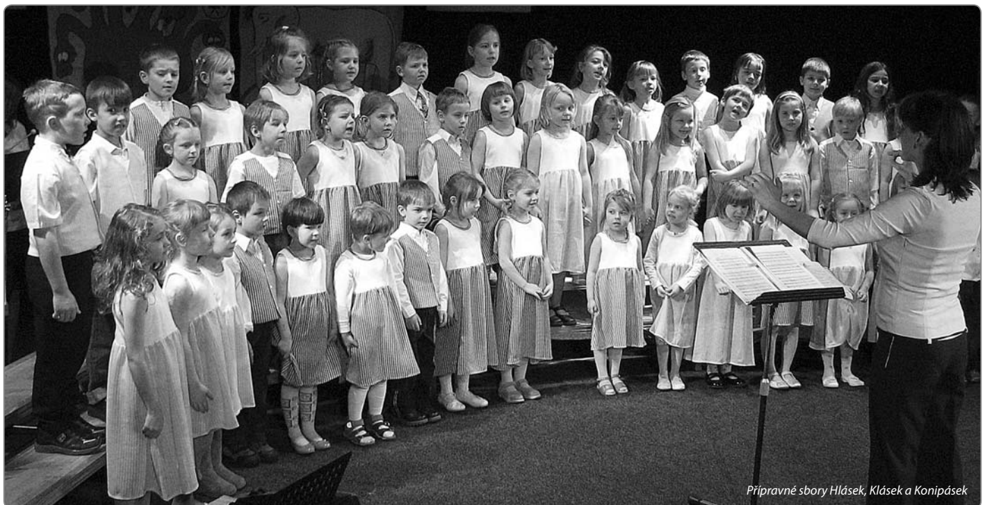
Přípravné sbory Hlásek, Klásek a Konipásek