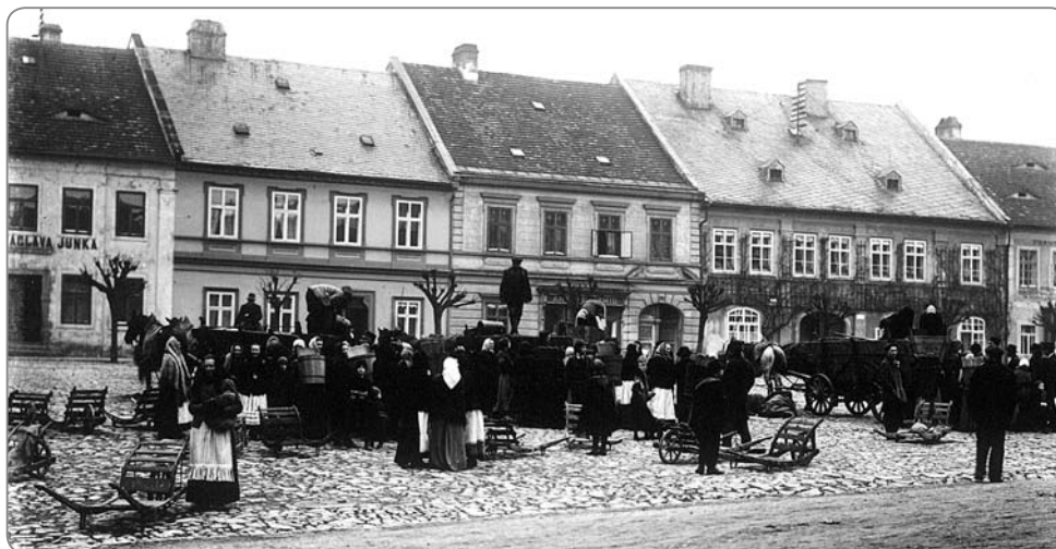
Také pravidelné týdenní trhy měly své místo výlučně na „ryнку“.