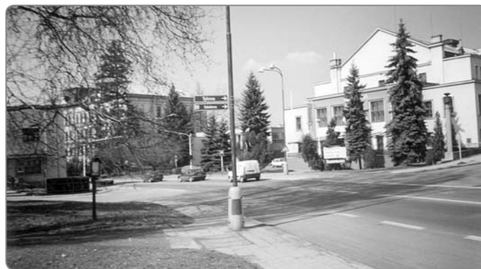
Současný pohled na bývalé náměstí čs. Legii.