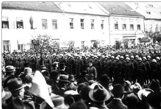
Náměstí bylo svědkem i slavnostních přísah nováčků československé armády.

šlechta. Tu následovalo i duchovenstvo v sociálním a právním ohledu. V průběhu 14. století nastává i diferenciaci venkovského obyvatelstva. Ve městech dochází k ostrým protikladům mezi bohatými měšťany, ře-