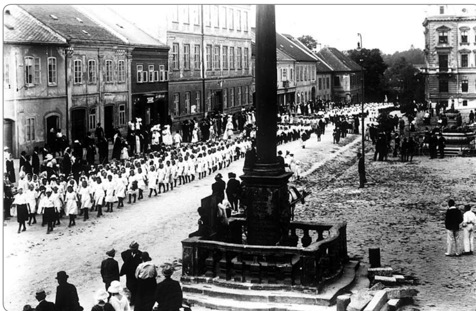
Průvody při slavnostech procházely náměstím (náměstí opatřené ještě kamennou dlažbou).