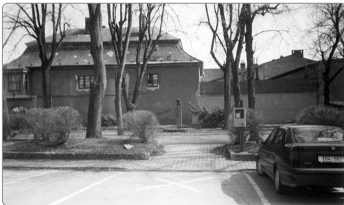
Třetí náměstí u kostela sv. Jiří – vzniklo po zrušení hřbitova kolem tohoto kostela.