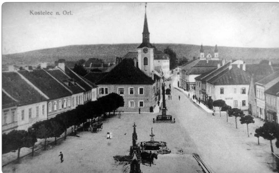
Pohled na Palackého náměstí před r. 1919 – kolem kašny nejsou ještě zasazeny lípy.

možnou alternativu. Zarovnat původní starý úval – příkop, který probíhal po severním obvodu zadních prostor (většinou zahrad) domů na náměstí. Potok, který probíhal po jeho dně, uzavřít do štol a získat tak spolu s rozšířením a úpravou cesty k bývalému Dvorečku potřebný prostor pro plánovanou výstavbu. Zároveň bylo nutné upravit cestu pro tuto lokalitu i snadný dosah z náměstí. Pro tento účel byla využita parcela v rohu náměstí – v místě tzv. chobotu, kterým byl přístup ke kostelíku na Rabštejně. Parcela tehdy náležela k zájezdnímu hostinci. Zbouráním zdi a úpravou svahu byla upravena cesta – dnes ulice Dukelských hrdinů. Zmíněný potok, který obtékal