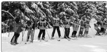
Ski klub Kostelec

Tak jako každý jiný rok i letos pořádá Ski Klub Kostelec nad Orlicí lyžařskou školu, která má dlouhohletou tradici. Letos již 34. ročník. Každoročně projde lyžařskou školou spousta dětí. Některé děti se vrací a zopakují si školu i několikrát po sobě. Na závěr lyžařské školy připravujeme závody ve sjezdovém lyžování a navíc ještě karneval na lyžích pro děti, rodiče i širokou veřejnost. Letošní rok byl opravdu vydařený, sněhové podmínky byly výborné. Děkujeme všem zúčastněným a těšíme se na příští rok. Fotky z letošního roku naleznete na skiha.rajce.idnes.cz nebo na www.skiklubkostelec.cz