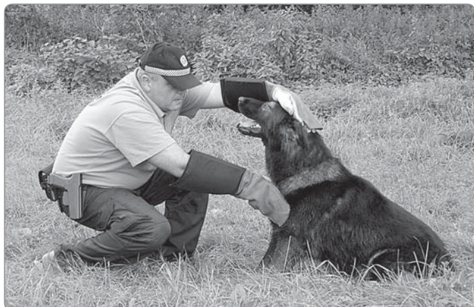
Ilustrační foto – odchyt volně se pohybujícího psa.

Především je nutné dopředu udělat všechna opatření, aby k zaběhnutí psa nedošlo, kontrolovat oplocení pozemku, mít psa na veřejnosti na vodítku.