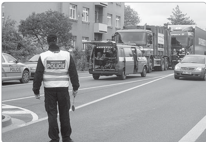
Usměrnování dopravy při dopravní nehodě, spolupráce s HZS Kostelec nad Orlicí a PČR.