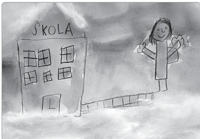
Těšíme se na vás, děti a p. učitelky MŠ Krupkova

My jsme děti z MŠ Krupkova a hledáme nové kamarády. Jestli právě vy, holčičky a kluci, chcete navštěvovat naši malou školičku, přijďte se mezi nás podívat. Budeme se těšit na vaši návštěvu 25.3. 2010 od 14. hod. do 17. hod. v 1. třídě MŠ Krupkova. Právě v tento den proběhne „Zápis do MŠ“. Rodiče si s sebou vezmou platný průkaz totožnosti, tiskopis k přijetí dítěte do MŠ si můžou předem vyzvednout přímo v MŠ Krupkova, nebo na odboru školství městského úřadu. A co na naší návštěvě budete dělat vy, naši budoucí kamarádi? Můžete si zahrát a prohlédnout prostředí, ze kterého si odnesete spoustu nových zážitků.