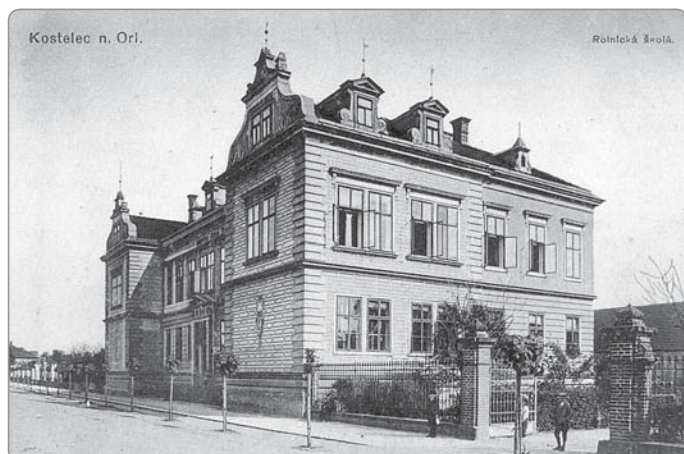
Rolnická škola 1990

Osmdesátá léta 19. století zaznamenala v českých zemích rychlý rozvoj zemědělského školství. Na radu svého strýce, zemědělského průkopníka Loučného, se připravil k učitelským zkouškám na nově zřizované rolnické školy a již v roce 1885 se dostal na zimní Hospodářskou školu v Kuklenách pod známého ředitele Františka Bauera, jenž později přišel jako první ředitel na Rolnickou školu v Kostelci nad Orlicí. V roce 1886 byl Antonín Půhoný jmenován ředitelem Hospodářské školy v Hořovicích. Tam již působil mezi