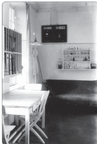
Ordinace sociálně zdravotních odborů.