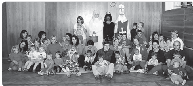
Cvičení rodiče a děti 1 - 3 roky.

V úterý 6. prosince bylo v našem sokolském cvičení nezvyklé napětí. Po rozvíčce děti netrpělivě čekaly na cinkání čertovského řetězu. Protože tu cvičí samé šikovné a hodné děti, čertík byl milý, a tak se vše obešlo bez strachu a slziček. Děti si odvážně podaly ruku s čertem, Mikulášem a andělem, dostaly sladkost a společně jsme se vyfotili.