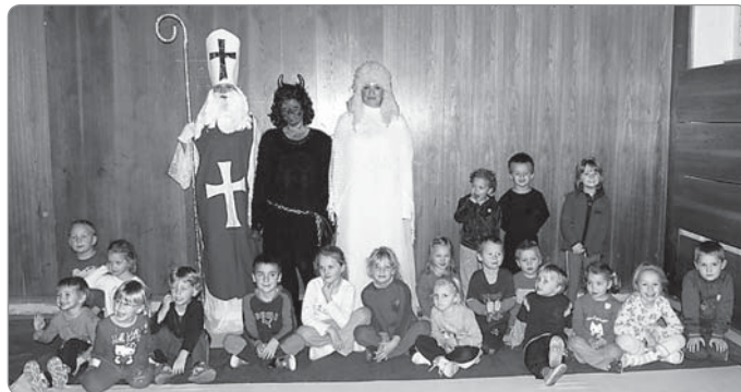
Cvičení rodiče a děti 3 - 6 let.

Jsm rádi, že si rodiče uvědomují důležitost pohybu a v rámci zdravého životního stylu vedou děti ke cvičení již od raného věku, a proto zažíváme spoustu radostných chvil při pohybových aktivitách. V novém roce 2012 Vám přejeme hodně chuti ke cvičení.