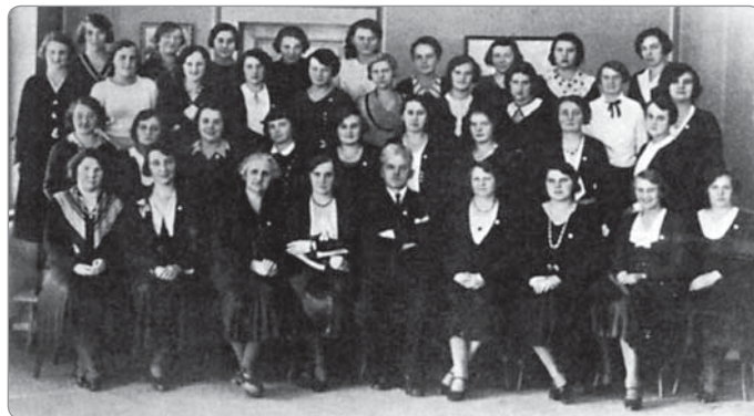
Příště Díl 6. - léta 1937 - 1952

Mužský sbor Orlice zazpíval samostatně 27. května při příležitosti 53. narozenin prezidenta Edvarda Beneše. Slavnost zahájil Smetanovým Slavnostním sborem a zakončil ji státní hymnou.