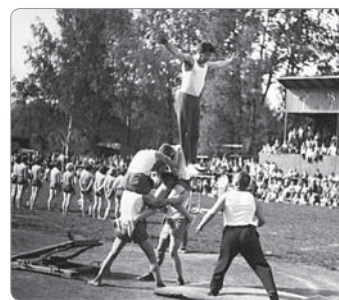
Kostecké hřiště Pod strání u příležitosti první celookresní spartakiády v roce 13.6.1954