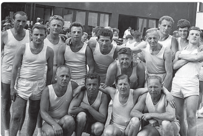
Na třetí C.S. v Praze cvičili tito cvičenci.