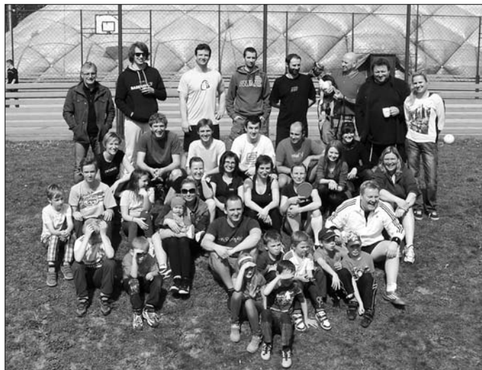
Foto: účastníci turnaje ve stolním tenise Oddíl volejbalu žen, TJ Sokol Kostelec nad Orlicí

Po loňských úspěšných turnajích se dne 11. 04. konal letos první turnaj ve stolním tenise PINEC CUP pro převážně amatérské hráče ze sportovních oddílů TJ Sokol, jejich dětí a přátel v herně stolního tenisu v Sokolovně. Celkem se turnaje tentokrát zúčastnilo 16 nadšených hráčů, pro které kromě možnosti sportovního vyžití bylo připraveno výborné občerstvení v režii Jany a Moniky. Letos došlo během turnaje k novince, kdy kromě zápasů ve dvouhře všichni účastníci změřili své síly v turnaji čtyřhry, kdy dvojice byly určeny náhodným losem. Pro všechny účastníky byly na konci dne po skvělých výkonech připraveny malé ceny, za které děkujeme sponzorům AG Typ Tiskárna, Instalaterství Vonásek s. r. o, Wande – výrobky z padákové šnůry. Turnaj se opět setkal s velkým ohlasem nejen hráčů, ale i spousty diváků, a proto podobné sportovní zápolení nejenom ve stolním tenise určitě naplánujeme znovu. Za příjemně strávený den děkujeme také TJ Sokol za možnost využít hernu stolního tenisu.