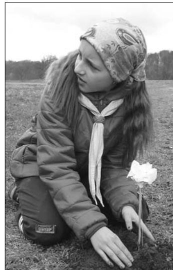
Žabka s růží

V neděli jsme se potkaly s byznysmenem a zkusily si zapamatovat co nejvíce čísel. Poté jsme se potkaly s liškou a objevily, jak je důležité přátelství. Pak nás už ale čekalo balení batohů a úklid. Jelikož však děvčata byla šikovná, zbyla nám i chvilka času navíc, který jsme využily k řádění po prolézačkách. Některé světlušky si i zkusily vylézt na strom. Poté jsme se však už opravdu musely rozloučit s Českou Skalicí i Malým princem a vlakem se vypravit na cestu domů. Výpravu jsme si velmi užily a těšíme se na další dobrodružství.