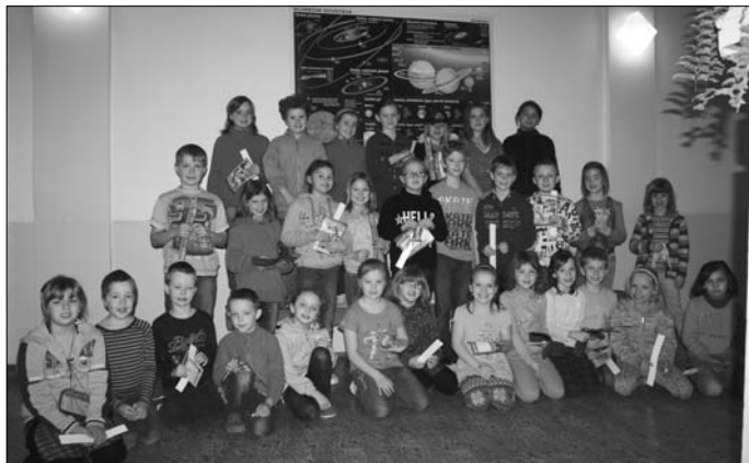
ocenění vrabčáci

Předvedli jste všichni výborné výkony, jen pozor, čtvrtáci, na některé vrabčáky z první a druhé třídy. Už teď vám šlapou na paty. Jediná rada – po celý rok skákejte a trénujte. Odměny za to určitě stojí. Tak za rok zase ahoj!