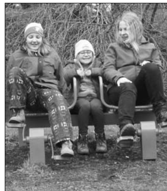
Jízda na „šlapadle“