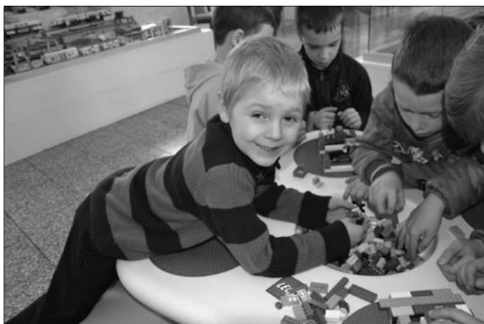
Výlet vlakem 02. 04. na výstavu stavebnice LEGO