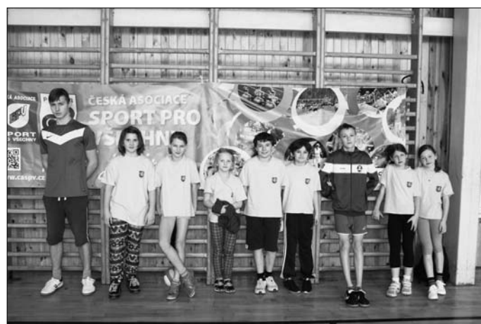
Foto: žáci ASPV v Hořicích

Krajského kola se zúčastnilo 154 dětí, proto všichni zasloužíte velké poděkování za předvedené výkony a věřím, že příští rok bude aspoň tak dobrý jako ten letošní.