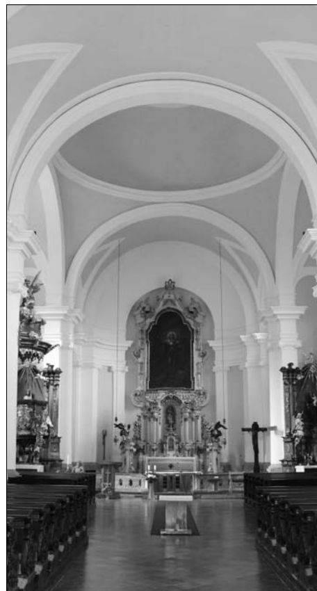
Foto: kostel uvnitř po výmalbě