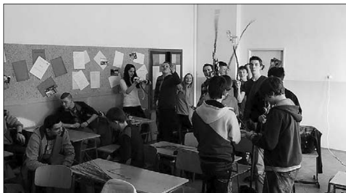
Foto: studenti Obchodní akademie T. G. Masaryka Kostelec nad Orlicí PaedDr. František Dosedla

V poslední žertovné hodině jsme v rámci předmětu Hospodářský zeměpis, jak je tradicí na OA TGM v Kostelci nad Orlicí pro 1. ročník oboru Informační technologie, vyráběli velikonoční pomlázky pro naši partnerskou školu ZŠ Kolowratská z Rychnova nad Kněžnou. Přestože se našli tací, kterým to šlo, neobešli jsme se bez výjimek, které mají ruce jako nohy, i tak všichni pletli s úsměvem na tváři. A tak si 1. C připomněla svátky jara.