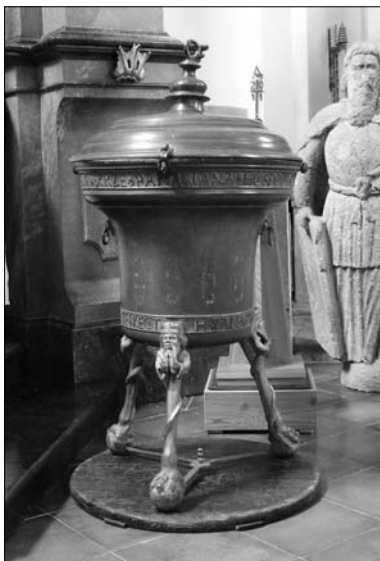
Foto: cínová křtitelnice z roku 1540