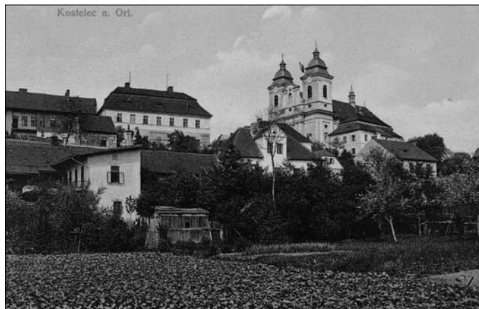
Foto: kostel sv. Jiří

průčelí byla provedena stavební firmou LAGUNA Solnice v roce 1995–96, včetně nátěru a opravy. V této souvislosti uskutečněna i výměna všech dožilých klempířských prvků v této části objektu za prvky z měděného materiálu. Zpět do interiéru kostela byla umístěna z exteriéru, od severní stěny presbytáře, v roce 2007 restaurovaná pískovcová plastika v podživotní velikosti (cca 1,3 m) socha Mojžíše v renesančním slohu, kol. r. 1600. Stojící vousatý muž v sukničce, kabátci a plášti, pravou rukou přidržuje desky (desatero). Obličejová partie je rozrušena. Nesla původně kazatelnu.