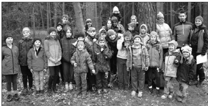
Foto: účastníci soustředění v orientačním běhu na mapě Běleč

Je již tradicí, že velikonoční čas bývá pro orientáky obdobím, kdy je třeba natrénovanou teorii z tělocvičny převést do praxe v lese. A tak jako každý rok jsme využili prodlouženého velikonočního víkendu k mapovému soustředění. Zázemí jsme tentokrát našli v krásném prostředí tábora J. A. Komenského v Bělči nad Orlicí. Soustředění se zúčastnilo 20 dětí, na které čekaly 4 mapové fáze, noční bodový, paměťový, velikonočně – zajícový a postřehový závod. Večer pak byl věnován rozborům tratí a mapové teorii. Ale ani ruce nezahálely a ty nejšikovnější děti si odvezly i pěknou upomínku, kterou si vlastnoručně vyrobily. Chtěl bych svoje svěřence pochválit za svědomitý přístup a pevnou vůli, které bylo potřeba, když již nohy bolely. Závodní sezóna nám začíná, a tak doufám, že nabyté zkušenosti zase přetavíme v cenné kovy nebo jen pěkné zážitky z lesa a s kamarády.