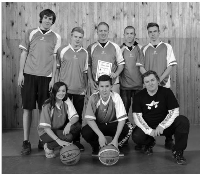
Foto: vítězný basketbalový tým