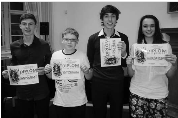
Foto: ocenění saxofonisté ZUŠ F. I. Tůmy