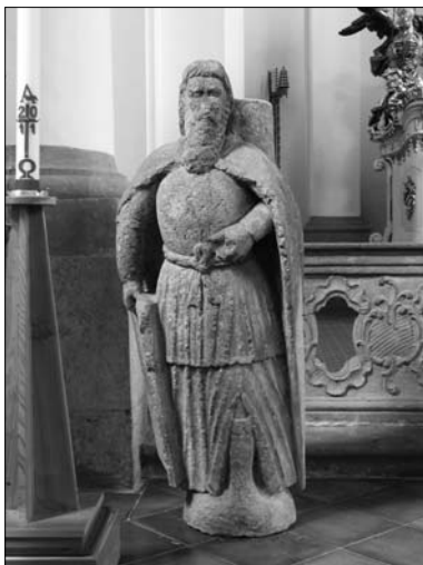
Foto: pískovcová plastika Mojžíše