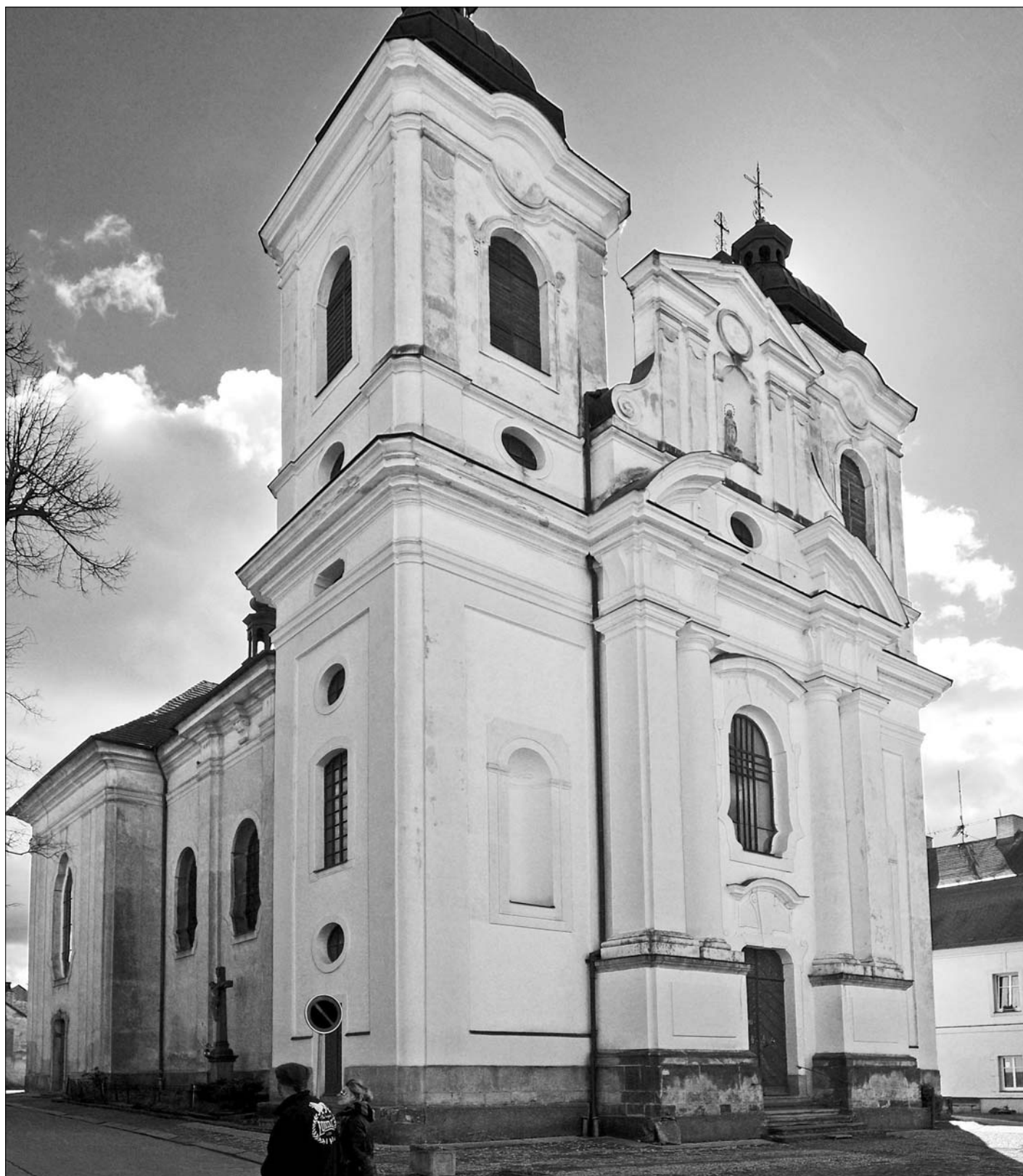
Kostel sv. Jiří, foto: Z. Fabiánek.