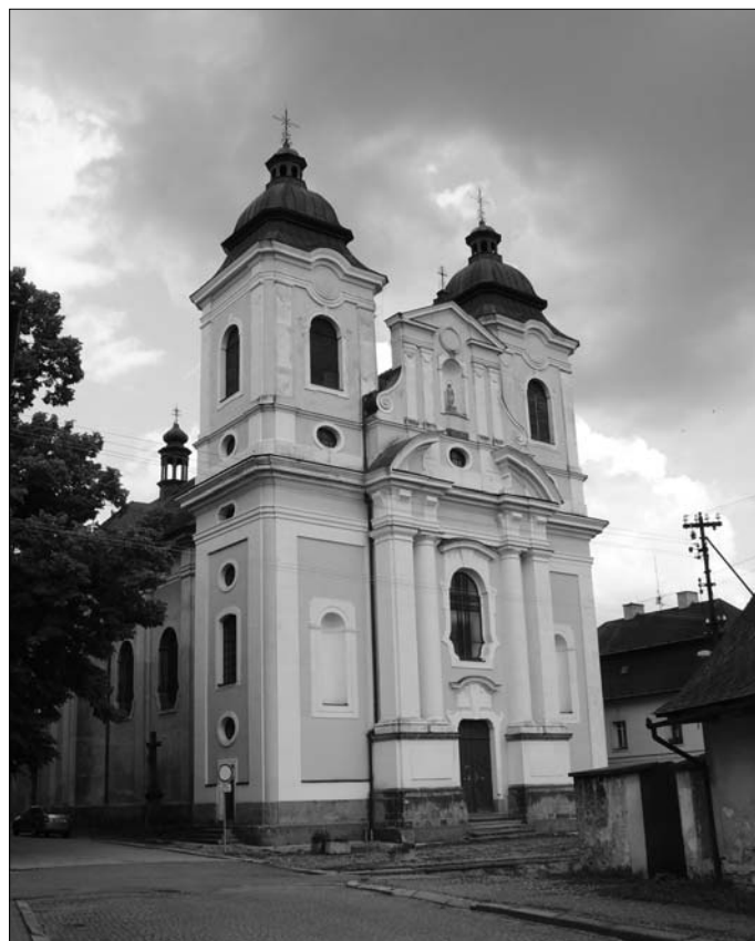
Foto: kostel sv. Jiří