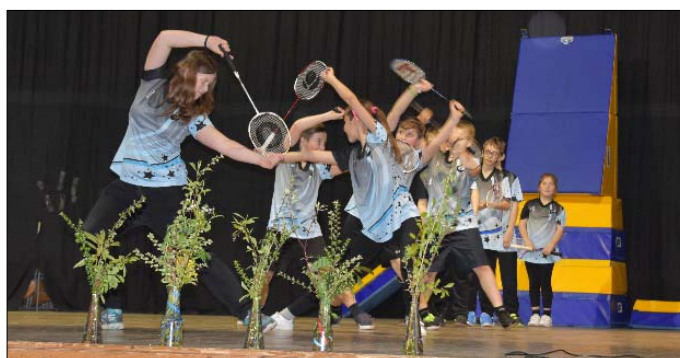
Výbor TJ Sokol