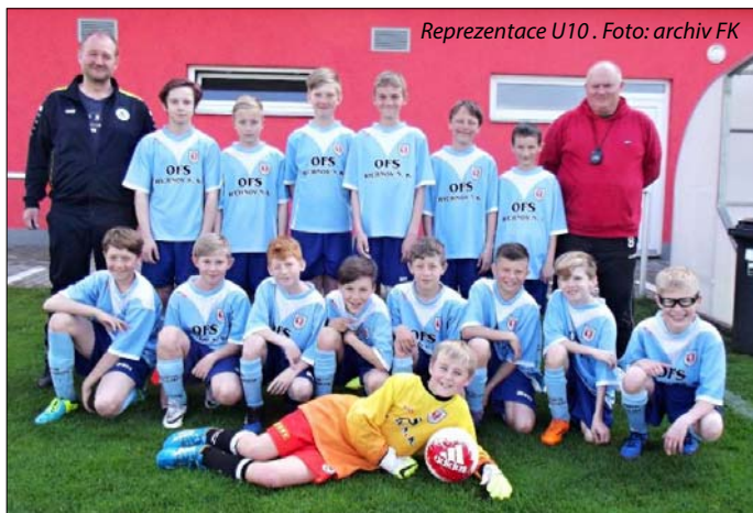
Reprezentace U10.