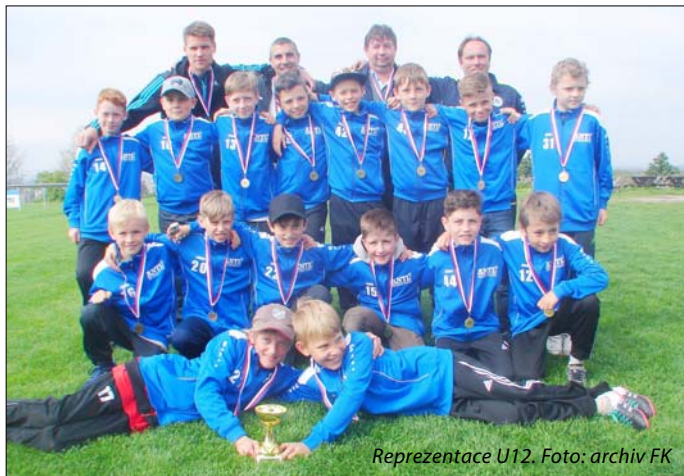
Reprezentace U12.