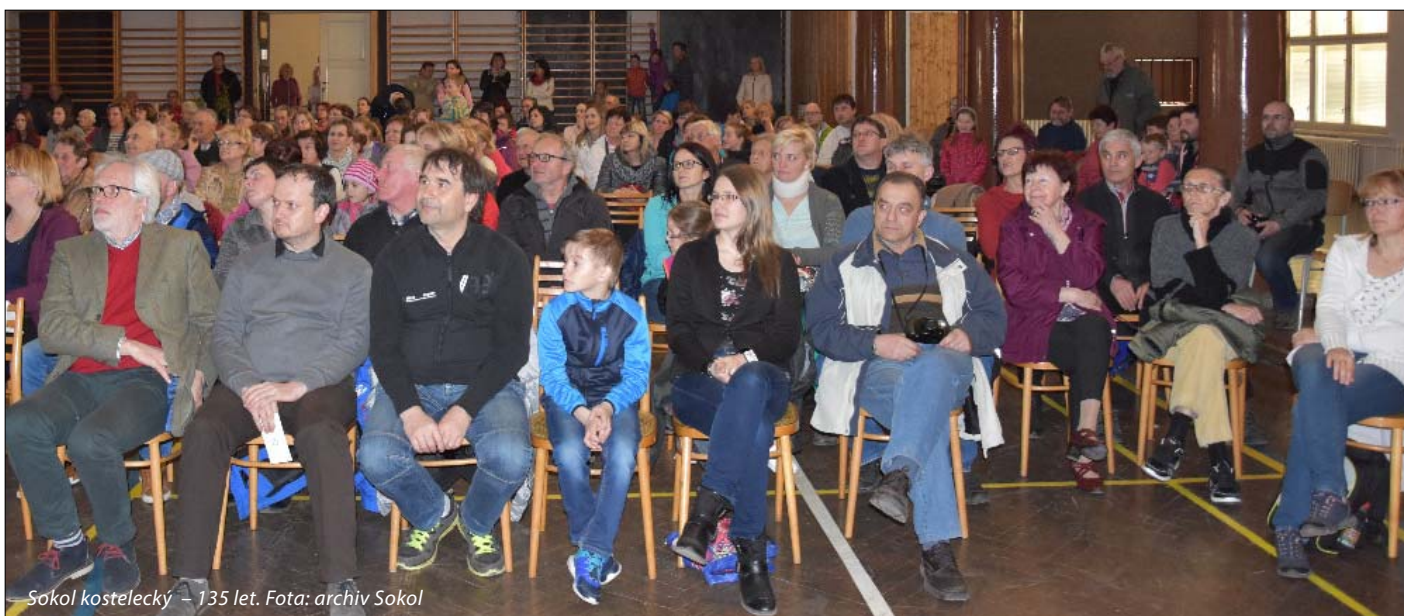
Sokol kostelecký – 135 let.