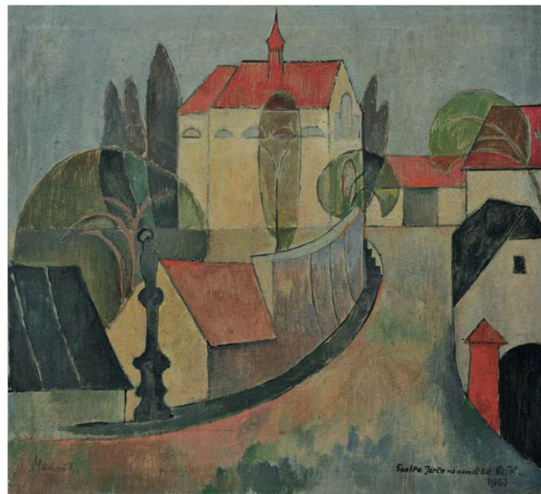
Václav Macháň, „Nedělní ráno“, olej, plátno /54 x 60 cm/ 1963

Krásná rána - a celý rok 2018 plný zdraví, úspěchů, optimismu, pohody, radosti i lásky přeje Vám i Vaším blízkým